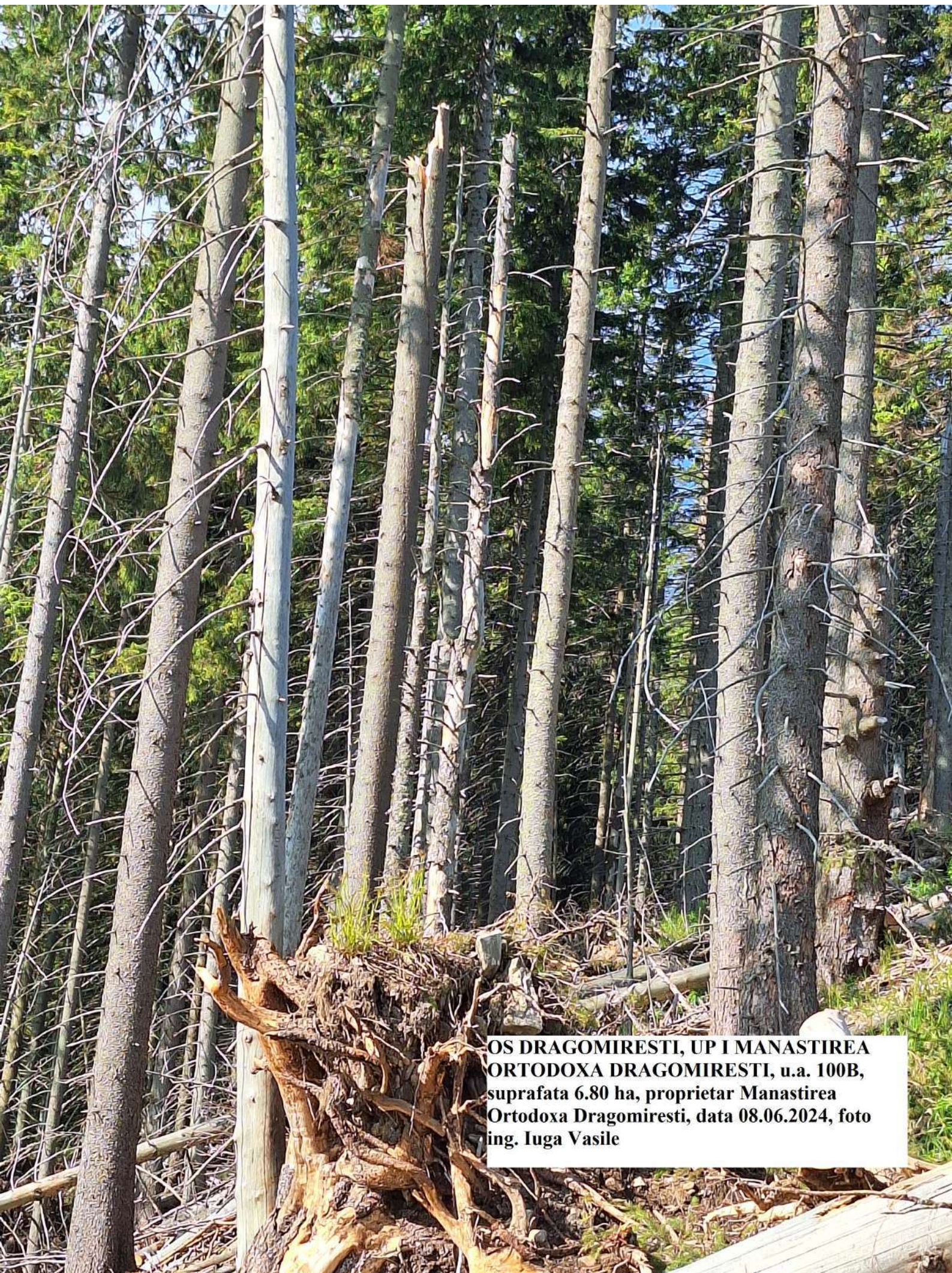
OS DRAGOMIRESTI, UP I MANASTIREA ORTODOXA DRAGOMIRESTI, u.a. 100B, suprafata 6.80 ha, proprietar Manastirea Orodoxa Dragomiresti, data 08.06.2024