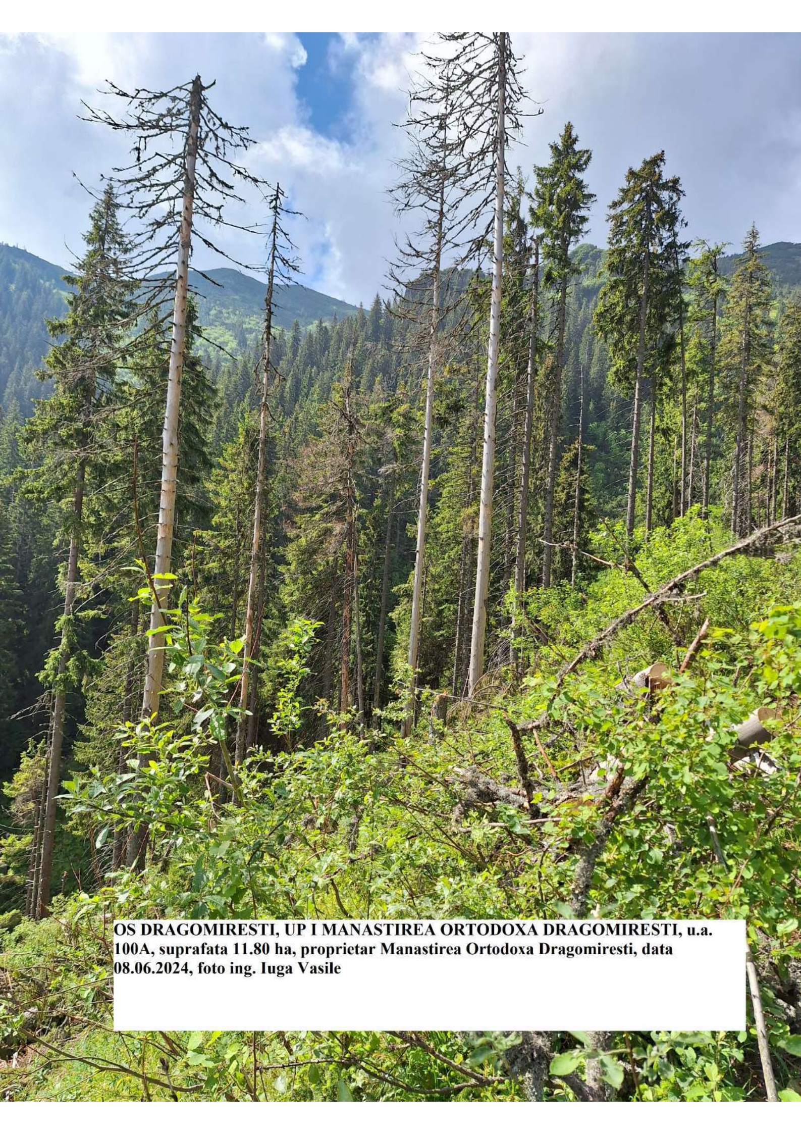
OS DRAGOMIRESTI, UP I MANASTIREA ORTODOXA DRAGOMIRESTI, u.a. 100A, suprafata 11.80 ha, proprietar Manastirea Ortodoxa Dragomiresti, data 08.06.2024