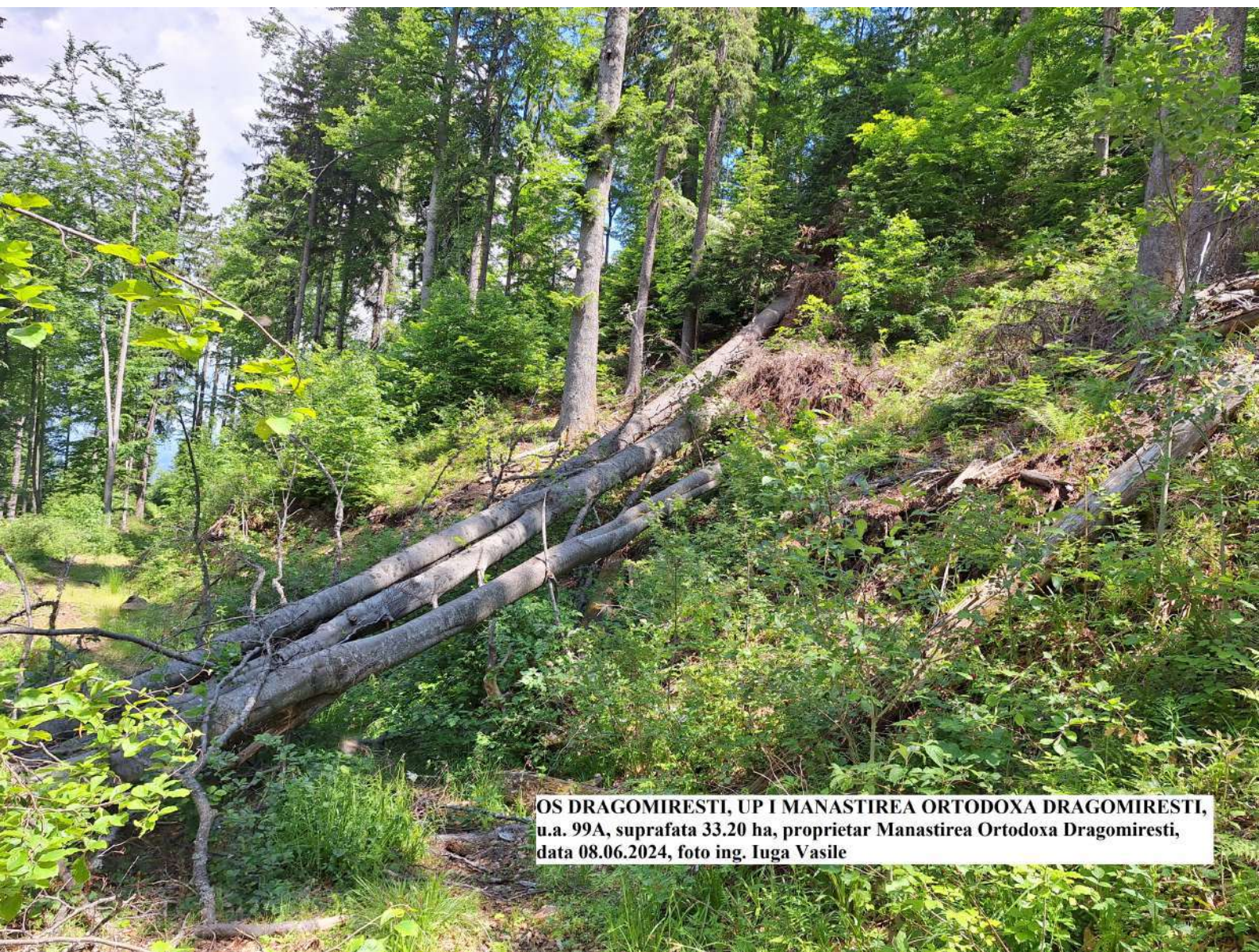
OS DRAGOMIRESTI, UP I MANASTIREA ORTODOXA DRAGOMIRESTI, u.a. 99A, suprafata 33.20 ha, proprietar Manastirea Ortodoxa Dragomiresti, data 08.06.2024