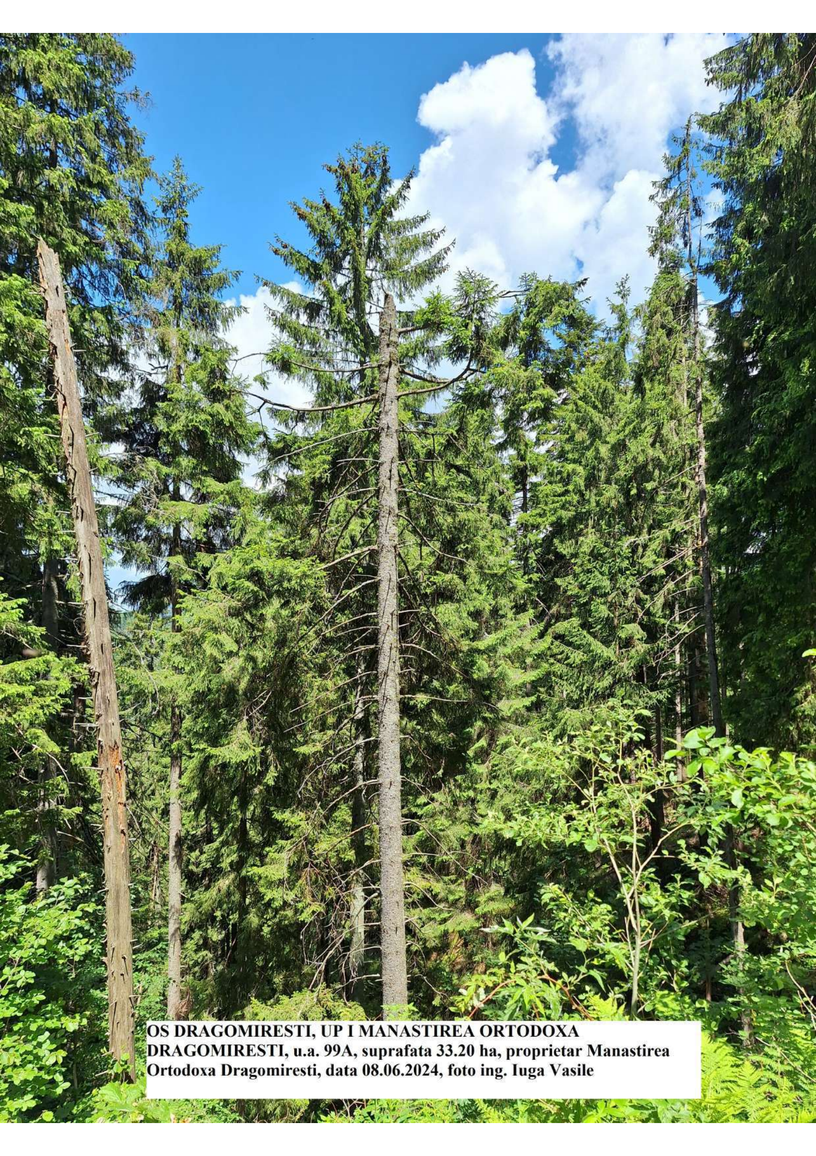
OS DRAGOMIRESTI, UP I MANASTIREA ORTODOXA DRAGOMIRESTI, u.a. 99A, suprafata 33.20 ha, proprietar Manastirea Ortodoxa Dragomiresti, data 08.06.2024